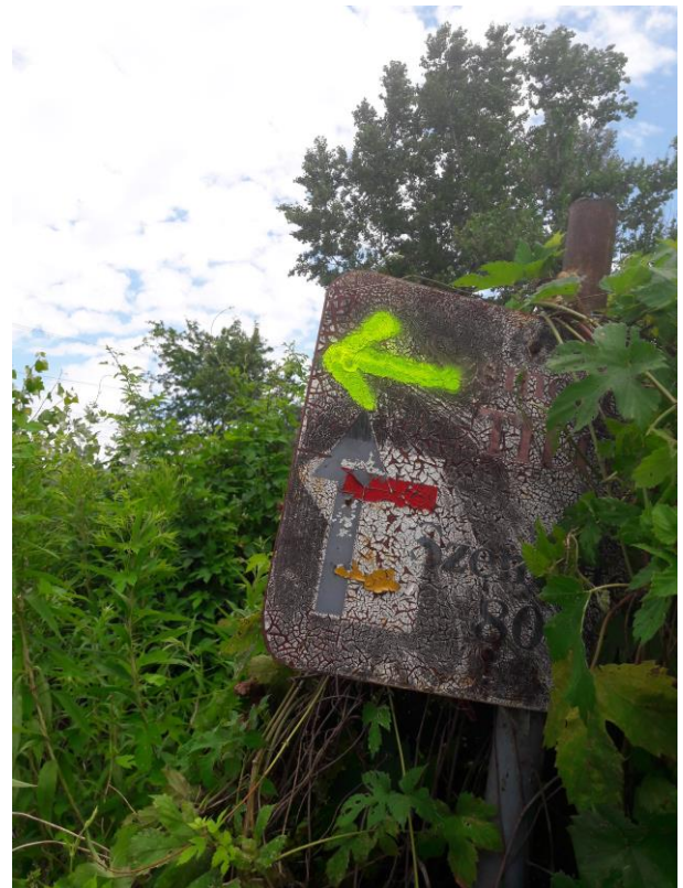
Saját, ideiglenes jelzések