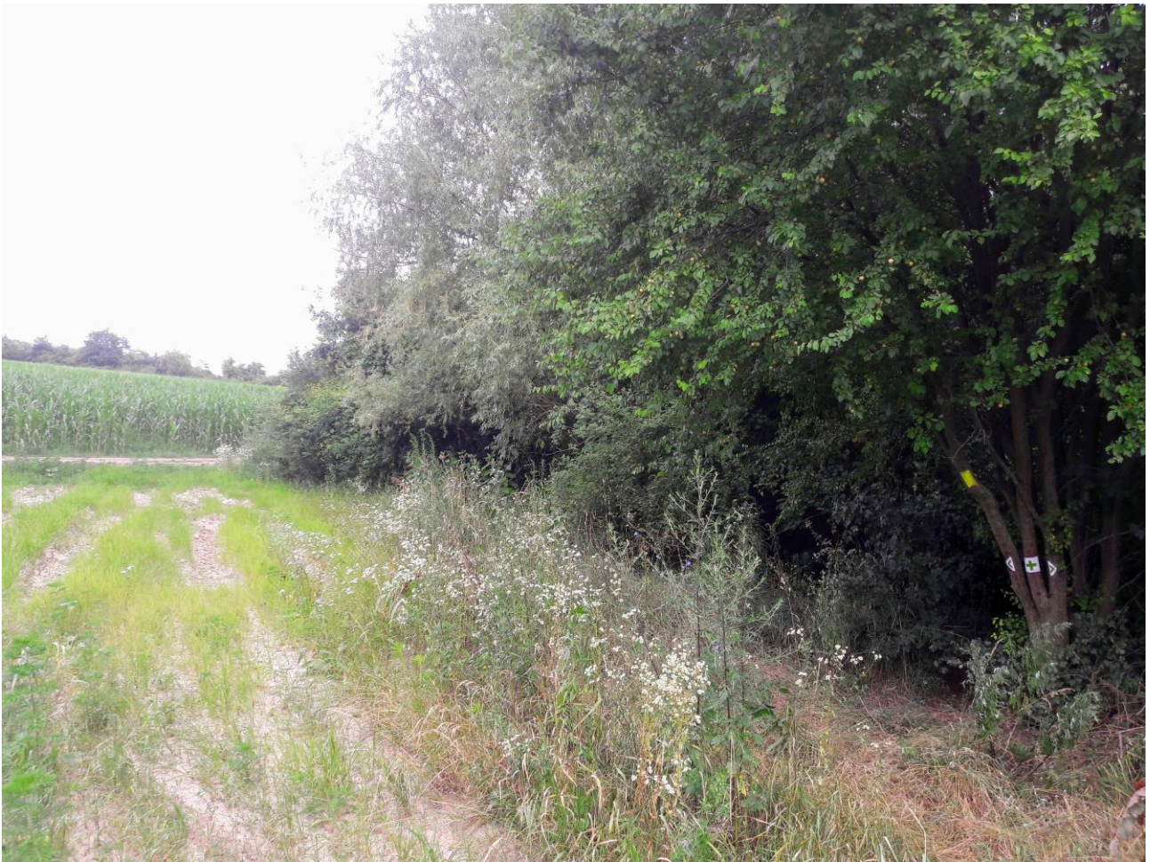
Az első QR kódos fa és a fluo-sárga négyszög, amit figyelni kell